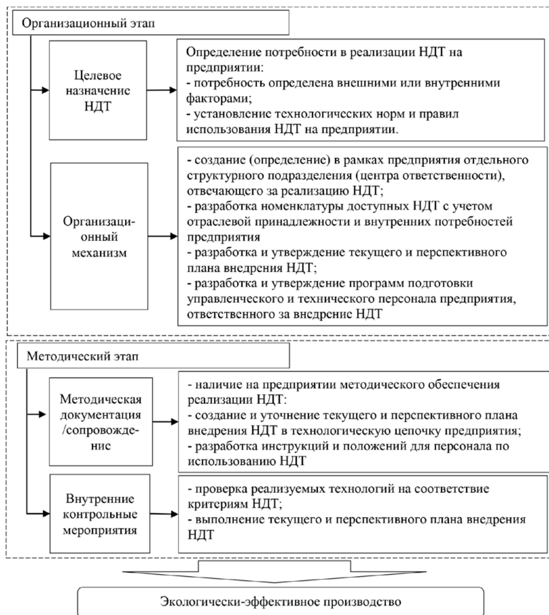
Рис. 2. Организационная модель сопроводительных мероприятий в промышленных организациях для получения комплексного экологического разрешения (КЭР)

Алгоритм организационного механизма выдачи комплексного экологического разрешения был предложен в работе Семилетовой Е.В. [7]. В данном исследовании автор акцентирует внимание на оценке эффективности государственного управления при внедрении наилучших доступных технологий. Выделяет общие и отраслевые показатели оценки промежуточных результатов перехода на НДТ, которые позволяют оценить внедрение принципа наилучших доступных