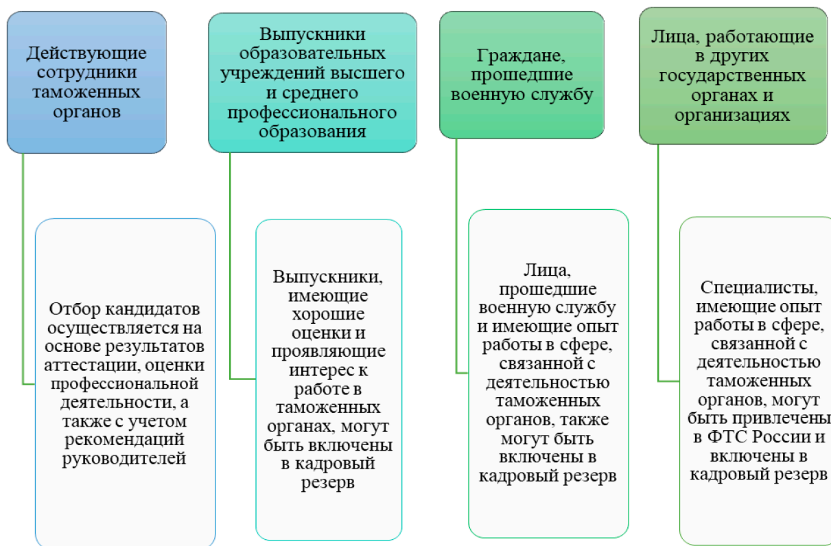
Рис. 1. Источники формирования кадрового резерва в ФТС России

Формирование кадрового резерва в таможенных органах включает в себя следующие этапы, рассмотренные на рисунке 2.