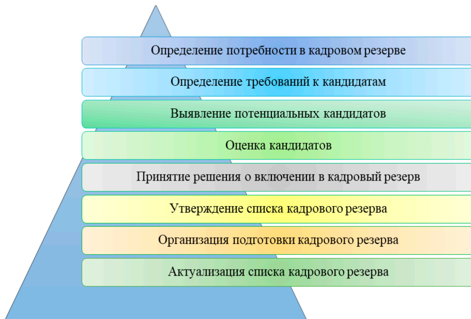
Рис. 2. Этапы формирования кадрового резерва