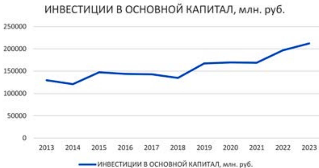
Рис. 1. Инвестиции в основной капитал в Белгородской области

Источник: составлено по данным https://31.rosstat.gov.ru/