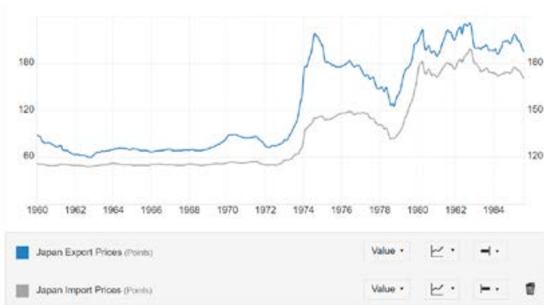
Рис. 2. Экспортные и импортные цены Японии