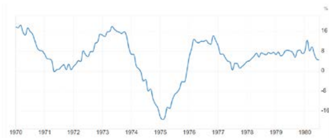
Рис. 4. Рост промышленного производства год к году