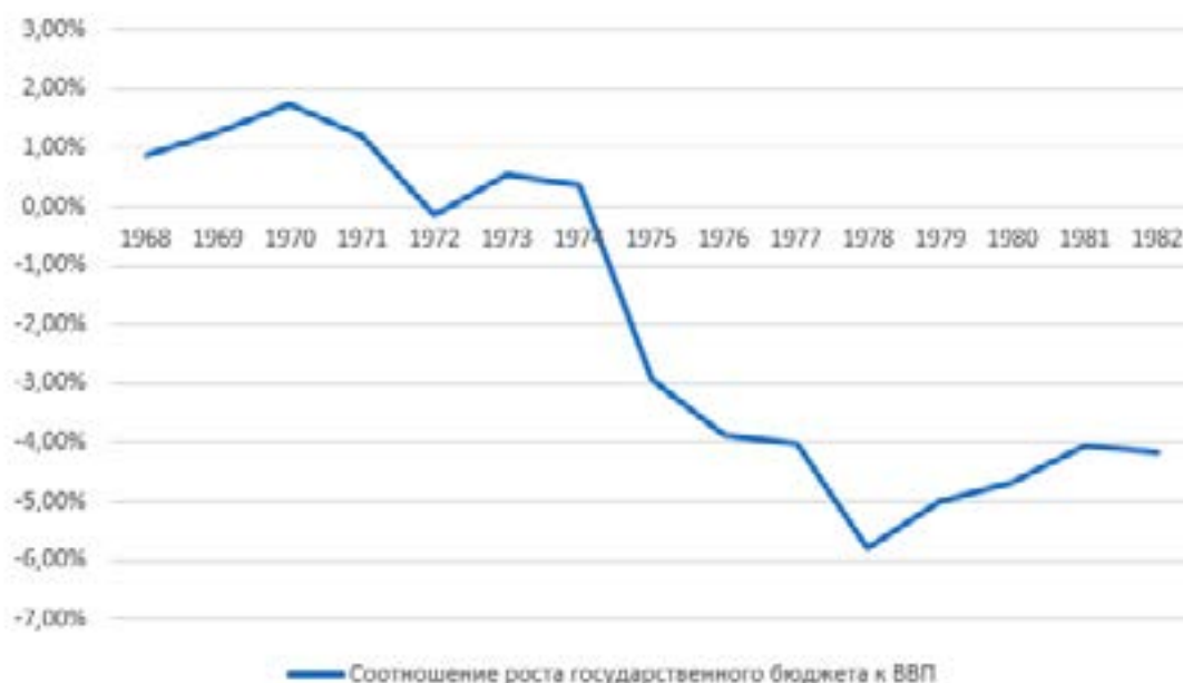
Рис. 5. Соотношение роста государственного бюджета к ВВП