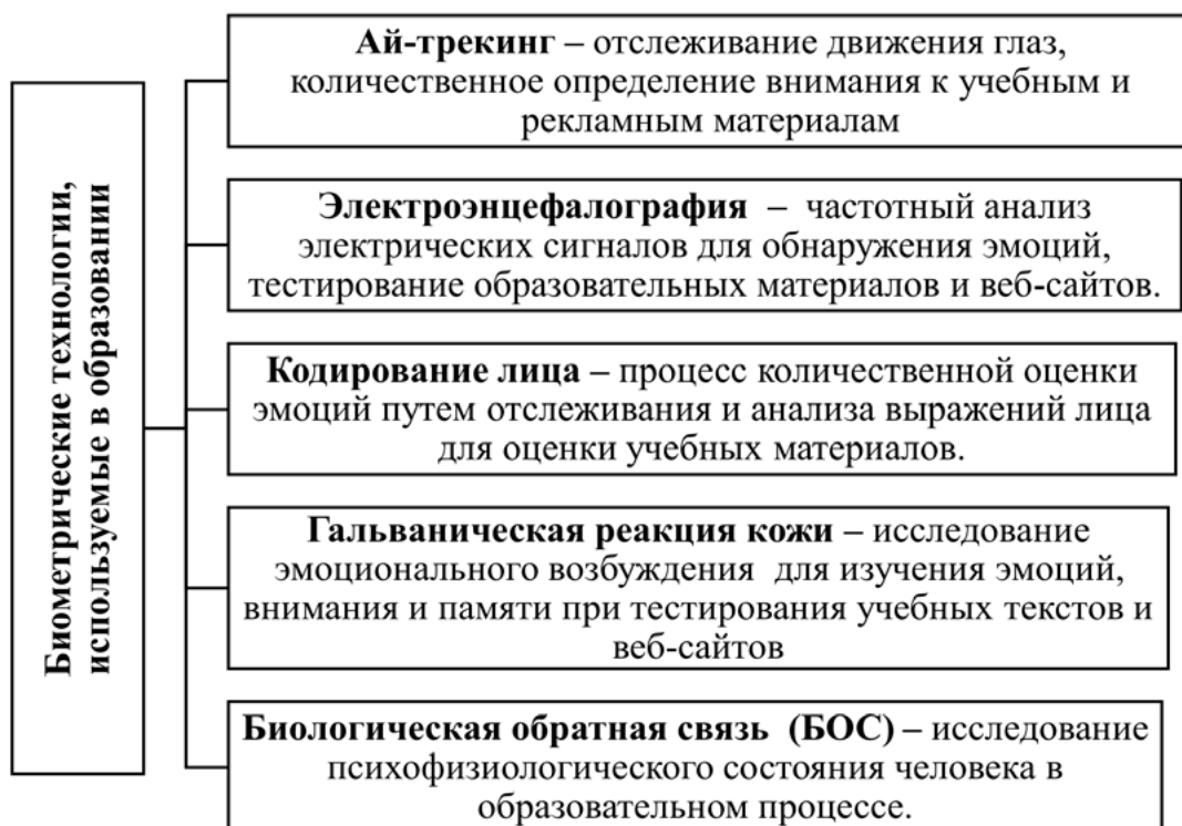
Рис. 2. Перечень биометрических технологий, используемых в образовании

В организации учебного процесса и его методическом сопровождении необходимо учитывать тренд «satisficing» – выбор подходящего (разумного), а не лучшего, реализацию стратегии принятия решений, направленной на удовлетворяющий результат, а не на оптимальное решение. Вместо того чтобы прилагать максимум усилий для достижения идеального результата, при решении задач сосредотачиваются на прагматических усилиях. Это связано с тем, что поиск оптимального решения может потребовать излишних затрат ресурсов. Обычно современными учащимися изучается только несколько наиболее доступных источников, а не проводится глубинное изучение и сравнение различных источников.