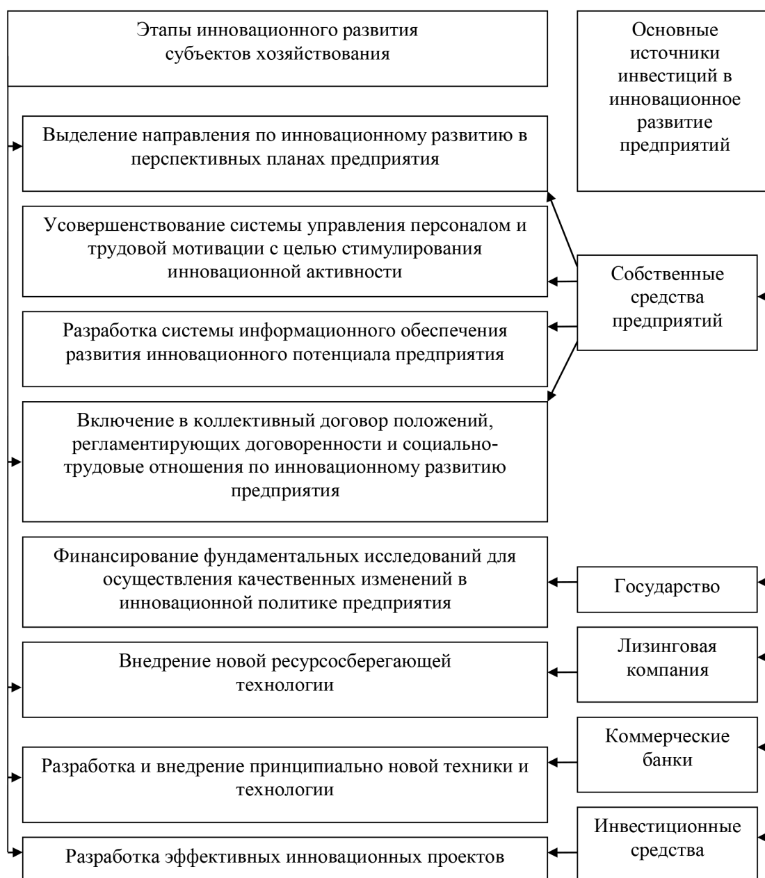
Рис. 2. Классификация этапов инновационного развития предприятий и источники их финансирования