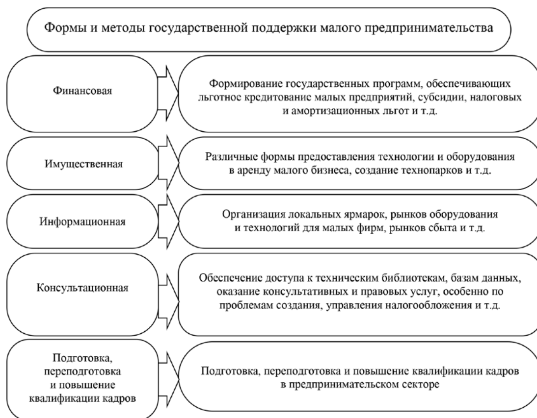
Рис. 1. Формы и методы государственной поддержки малого предпринимательства

На сегодня проблемами занятости в малом и среднем предпринимательстве остаются следующие: влияние пандемии коронавируса COVID-19; низкая оплата труда; неэффективная система стимулирования труда, высокий уровень текучести персонала; постоянные нарушения трудового законодательства; выплата заработной платы в «конвертах» (наличие серой заработной платы); наличие скрытой безработицы; есть проблемы, связанные с тем, что трудовые отношения работодателя и работником не оформляются должным образом. Структура малых и средних предприятий по видам экономической деятельности на конец 2021 года представлена на рис. 2 [9].