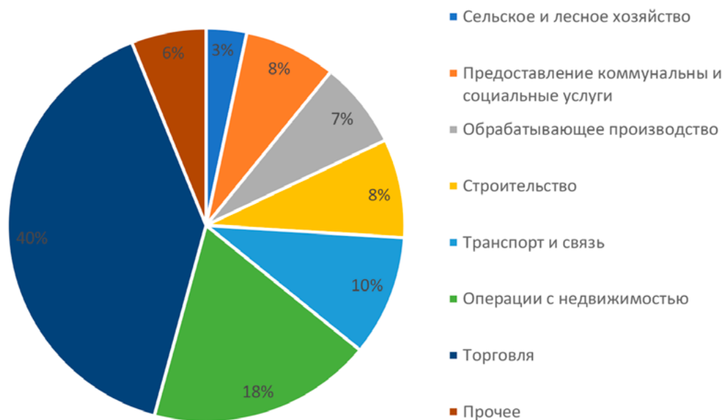
Рис. 2. Отраслевая структура малого предпринимательства в Российской Федерации по видам экономической деятельности на конец 2021 г., %