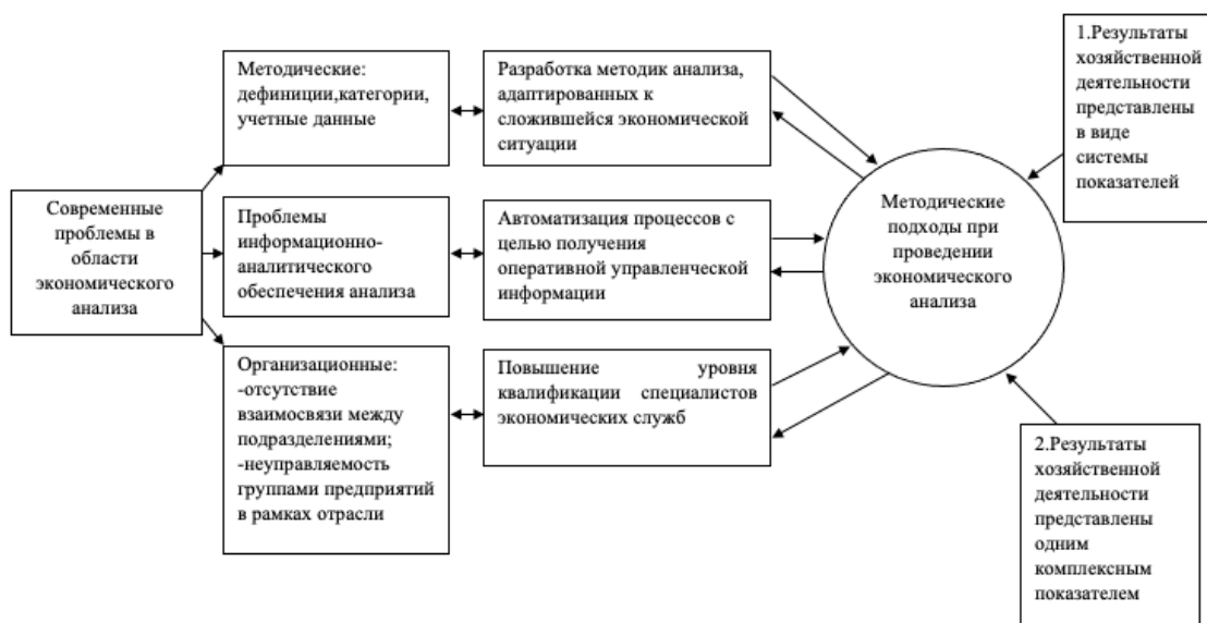
Рис. 1. Современные проблемы и методические подходы при проведении экономического анализа

При анализе внутренних и внешних факторов как на отдельном предприятии, так и в целом по отрасли возникают проблемы, связанные с: