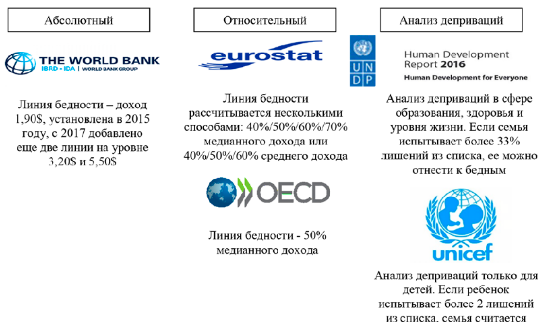
Рис. 2. Международные практики измерения уровня бедности

2. Индекс материальных деприваций – доля населения, живущая в домохозяйствах, которые из-за нехватки средств не могут себе позволить по крайней мере 4 пункта из следующего списка: