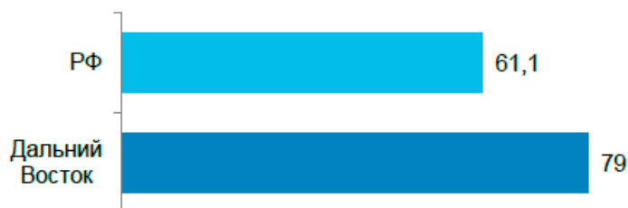
Рис. 2. Темп прироста количества операций по оплате товаров и услуг с использованием платежных карт (2020 г. к 2018 г.), %