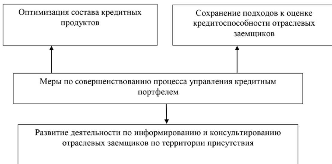
Рис. 3. Меры по совершенствованию процесса управления кредитным портфелем для АО «Россельхозбанк»

Из прогноза следует, что объем кредитного портфеля будет постепенно расти и к 2023 году увеличится на 333 161, 653 млн. руб. по сравнению с 2020 годом, что является положительным моментом. Прогноз кредитного портфеля можно считать достоверным, так как коэффициент R^2 равен 0,98%. Объем просроченной задолженности увеличится в 2023 году на 104 756,398 млн. руб. по сравнению с 2020 годом, что является отрицательным моментом, однако коэффициент R^2 , который отображает качество линии тренда равен 0,77%, что говорит о низкой достоверности линии, а соответственно и о прогнозируемых значениях. Такое низкое значение R^2 можно связать с сильной изменчивостью просроченной задолженности.