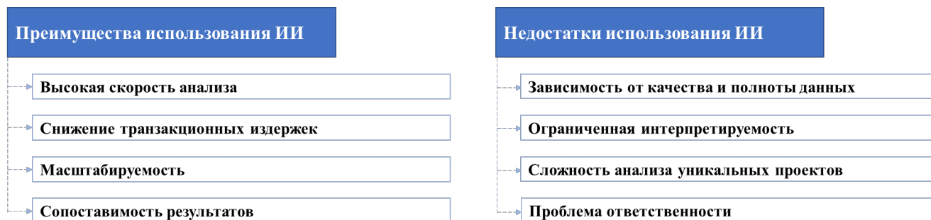
Рис. 2. Преимущества и недостатки алгоритмического анализа

Также важно рассмотреть сильные и слабые стороны подхода (рис. 2).