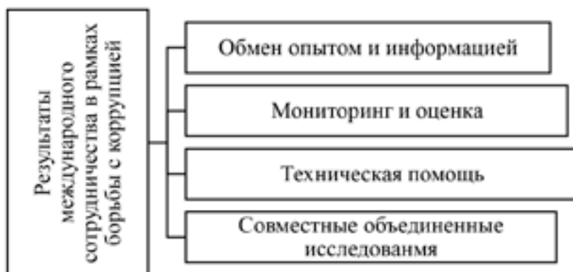
Рис. 3. Международное сотрудничество в рамках борьбы с коррупцией