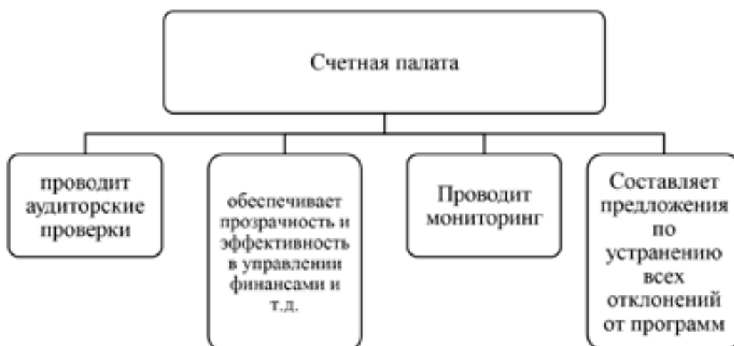
Рис. 1. Роль и сущность Счетной палаты РФ