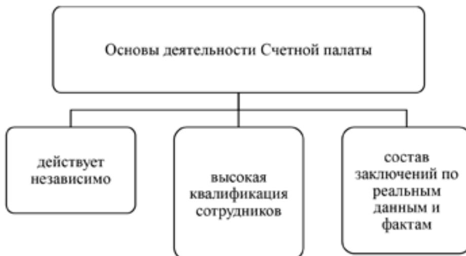
Рис. 2. Основы деятельности Счетной палаты