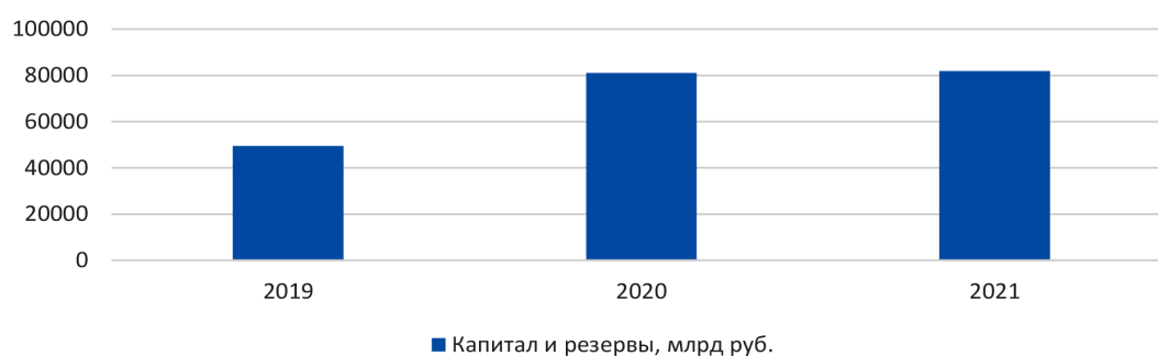
Рис. 5. Капитал и резервы малых предприятий в РФ с 2019-2021 гг.