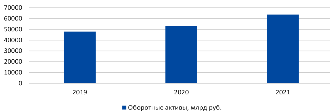
Рис. 4. Оборотные активы малых предприятий в РФ с 2019-2021 гг.