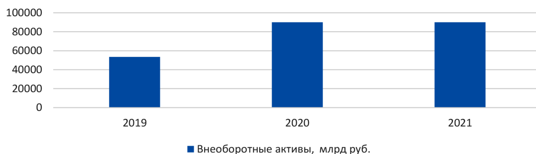
Рис. 3. Внеоборотные активы малых предприятий в РФ с 2019-2021 гг.