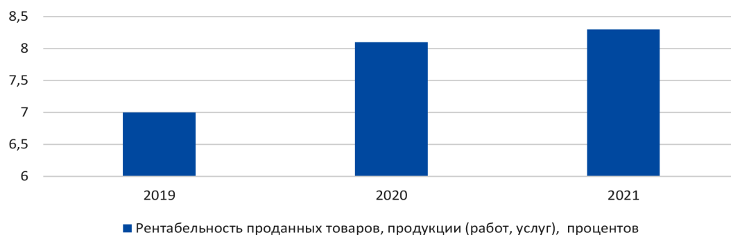
Рис. 7. Рентабельность проданных товаров, продукции (работ, услуг) малых предприятий в РФ с 2019-2021 гг., %