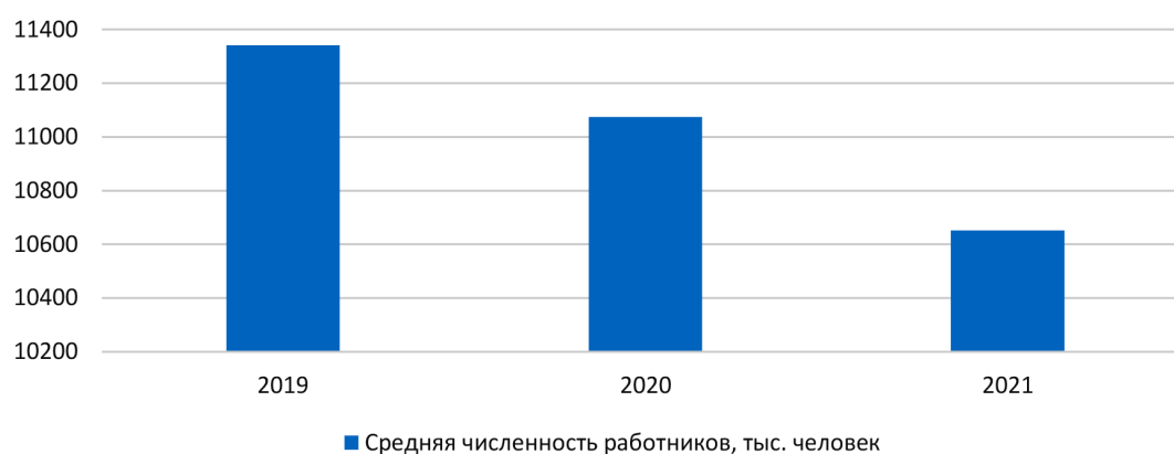
Рис. 1. Средняя численность работников малых предприятий в РФ с 2019-2021 гг.