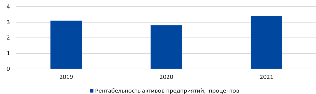
Рис. 8. Рентабельность активов малых предприятий в РФ с 2019-2021гг., %