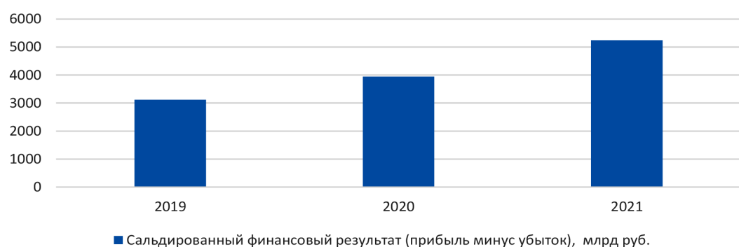
Рис. 6. Сальдированный финансовый результат малых предприятий в РФ с 2019-2021 гг.