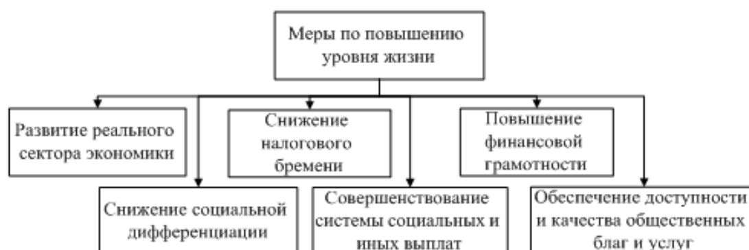
Рис. 2. Меры по повышению уровня жизни