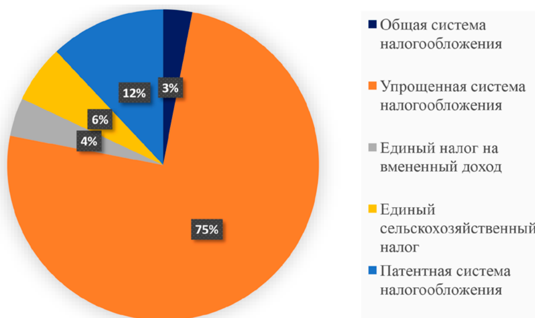
Рис. 3. Соотношение числа субъектов малого предпринимательства, находящихся на общей системе налогообложения и специальных налоговых режимах в 2021 г. на территории РФ, %

Первое, что необходимо отметить, это то, что прирост поступлений по всем налогам, взимаемым в связи с применением специальных налоговых режимов, увеличился на 79,27% по сравнению с 2017 г. Увеличение в 2021 г. по сравнению с предыдущим периодом было в 2 раза меньше и прирост составил +35,22% в 2021 г. к 2020 г.