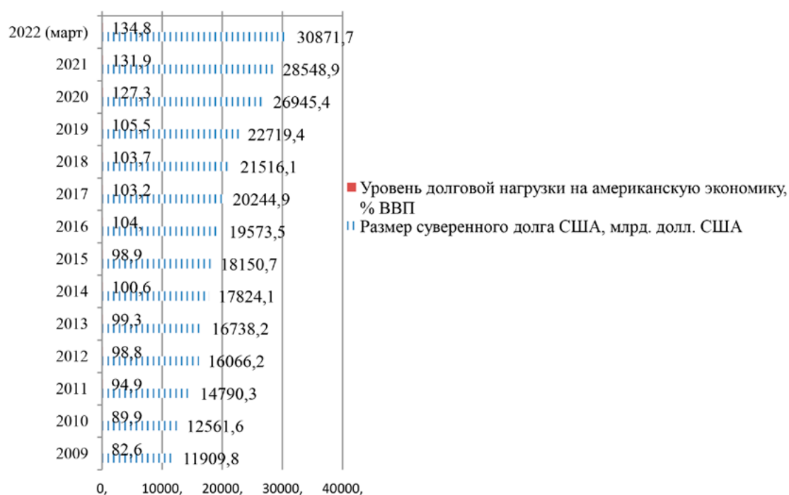
Рис. 2. Динамика суверенного долга США и налогового бремени экономики страны в 2009–2020 гг.

Примечание: составлено автором по: [Официальный сайт Министерства финансов США. [Электронный ресурс]. URL: https://home.treasury.gov/ (дата обращения: 22.06.2022)].