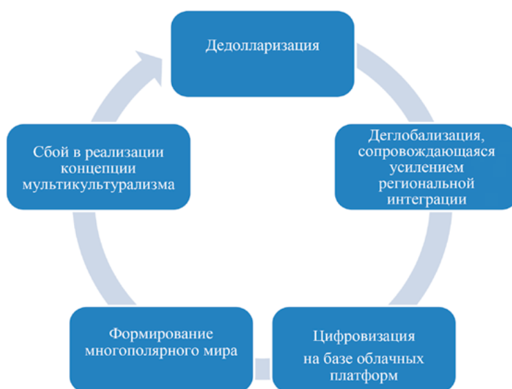
Рис. 1. Необходимые элементы в планах развития региональной организации, формирующей маркетинговую повестку в условиях санкционного давления

– выполнение американской экономики роли крупнейшего торгового и финансового хаба, при этом для работы с рядом инструментов указанный хаб до настоящего времени продолжает оставаться безальтернативным.